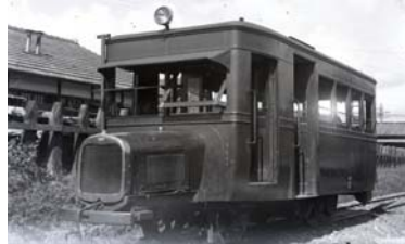
キッド2ガソリンカー写真(昭和)