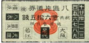
8区片道券(大正13)大軌