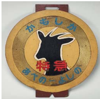
特急かもしか号ヘッドマーク (昭和36~40)近鉄