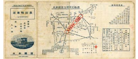
汽車時刻表(昭和6)大和鐵道