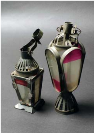
120 ラマダン・ランプ「ファヌース」