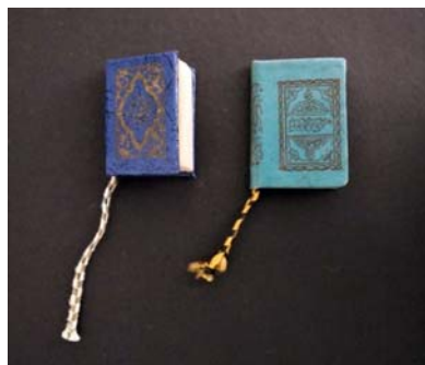
122 クルアーンの豆本のお守り