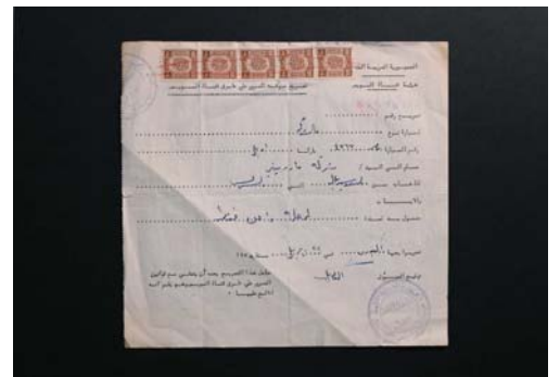
8 スエズ運河航行許可証